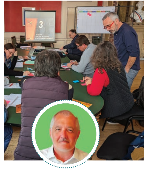
Schéma directeur cyclable en cours

Son objectif : améliorer les déplacements quotidiens à vélo, mettre en cohérence les équipements déjà en place, organiser le maillage de pistes cyclables ou voies aménagées afin de favoriser l'usage du vélo pour les déplacements quotidiens en Serein et Armance. Les usages touristiques et de loisirs ne sont pas directement ciblés par ce schéma mais les voies en cours de réalisation ou déjà créées y seront intégrées. Pour identifier au mieux les besoins du territoire en matière de vélo-voie et de services associés (réparation, vente, location, stationnement...), le cabinet d'études spécialisé en