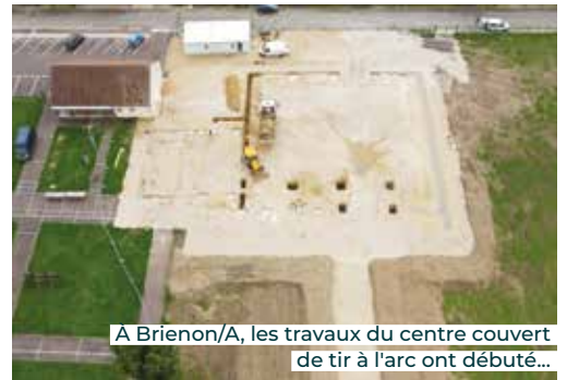
A Briennon/A, les travaux du centre couvert de tir à l'arc ont débuté...

travaux dans un esprit de partenariat et de complémentarité avec la CCSA avant que ne lui revienne le site. En 2022, les 40 employés ont quitté les locaux vétustes qu'ils occupaient dans un quartier pavillonnaire depuis 1980, pour un environnement plus adapté à leur activité. Pour la CCSA, cette opération de valorisation d'un espace vacant a permis de conserver une entreprise sur son territoire sans avoir à artificialiser d'espace naturel.